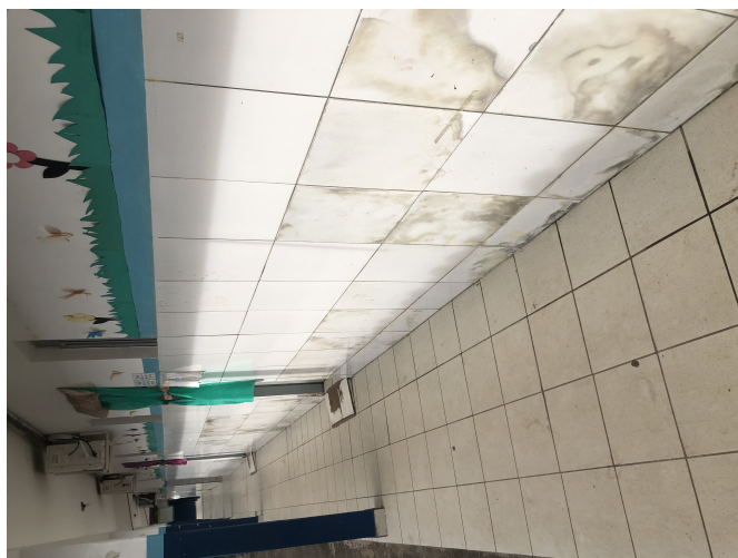
Figura 4: Rio Tinto-EMEF HERMAN LUNDGREN