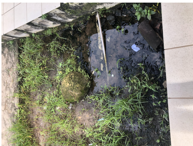
Figura 2: Rio Tinto-EMEF HERMAN LUNDGREN