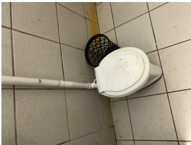
Figura 1: Rio Tinto-EMEF HERMAN LUNDGREN