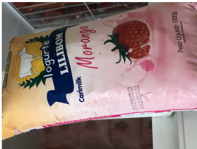
Figura 3: Rio Tinto-EMEF HERMAN LUNDGREN